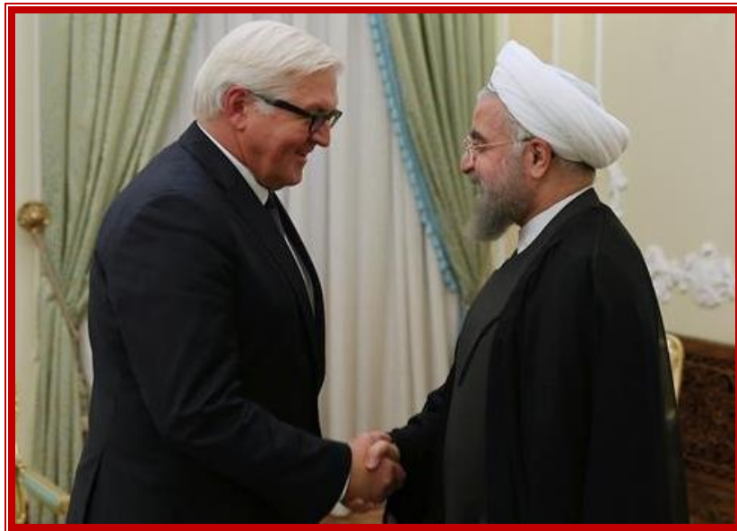
Ο Η. Rouhani υποδέχεται τον F.W. Steinmeier στην Τεχεράνη

κυρώσεων. 14 Με βάση τα επίσημα στατιστικά στοιχεία που εκδίδονται από το Υπουργείο Εξωτερικών της Γερμανίας, οι εισαγωγές του Ιράν από τη Γερμανία το 2014 παρουσίασαν αύξηση 30 τοις εκατό σε σύγκριση με το 2013 και ο όγκος του διμερούς εμπορίου αυξήθηκε 27 τοις εκατό. 15 Για να διευρυνθούν περαιτέρω οι επιχειρηματικές ευκαιρίες στο Ιράν, πραγματοποιήθηκε στη Φρανκφούρτη της Γερμανίας, ένα επιχειρηματικό φόρουμ, στο οποίο συμμετείχαν ιρανικές και ευρωπαϊκές αντιπροσωπείες. Το συνέδριο αυτό είχε ως σκοπό να ενημερώσει το γερμανικό επιχειρηματικό κοινό για το νέο επιχειρηματικό περιβάλλον της ιρανικής αγοράς, καθώς και για τα έργα τα οποία έχουν προγραμματιστεί να γίνουν τα επόμενα χρόνια από τον ιδιωτικό και το δημόσιο τομέα της χώρας, τα οποία σχετίζονται με έργα υποδομής στον τομέα της βιομηχανίας, των ορυχείων, των πετροχημικών, της ενέργειας, του νερού, των μεταφορών και της αστικής ανάπτυξης. 16